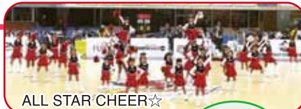
ALL STAR CHEER☆